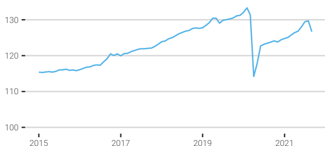
Fig. 1. Évolution de l'indice emploi salarié marchand

Source : CPS - ISPF, données corrigées des variations saisonnières (CVS) Indice 100 en janvier 2000