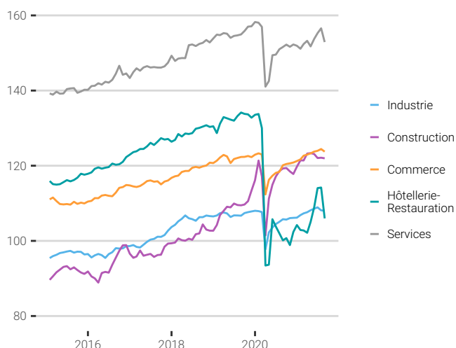
Fig. 2. Évolution des indices par secteur d'activités

Source : CPS - ISPF, données corrigées des variations saisonnières (CVS) Indice 100 en janvier 2000