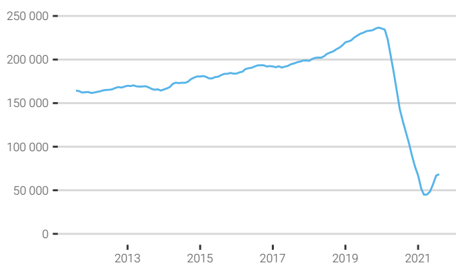
Fig. 1. Évolution de la fréquentation touristique